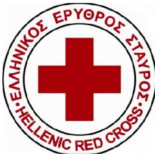
Ελληνικός Ερυθρός Σταυρός

2) Σε καιρό ειρήνης: η αρωγή και συμπαράσταση στα θύματα θεομηνιών και επιδημιών, καθώς και η αυτόνομη ή σε συνεργασία με το Κράτος και κοινωνικούς φορείς, ανθρωπιστική δραστηριότητα.